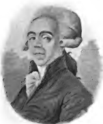
Jean Louis Baudelooque.

(1706—1773; Kriebelkrankheit), Everard Home (1763—1832; Krupp), John Pringle (1707—1782; Militärmedizin), Johann Georg Zimmermann (1728 bis 1795; Ruhr, «Erfahrung in der Arzneikunst»), J. J. Plenck (1738—1807; berühmtes Lehrbuch der Hautkrankheiten), Joh. Ernst Wichmann (1740—1802; Aetiologie der Krätze), Simon André Tissot (1728—1797; Epilepsie, Onanie), John Fothergill (1712—1780; Tic douloureux) u. a. Vor allem glänzt hier der Name Edward Jenner (1749—1823), des Entdeckers der Kuhpockenimpfung (1796).